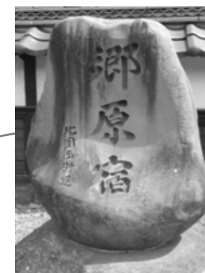
切り妻本棟造りの建物