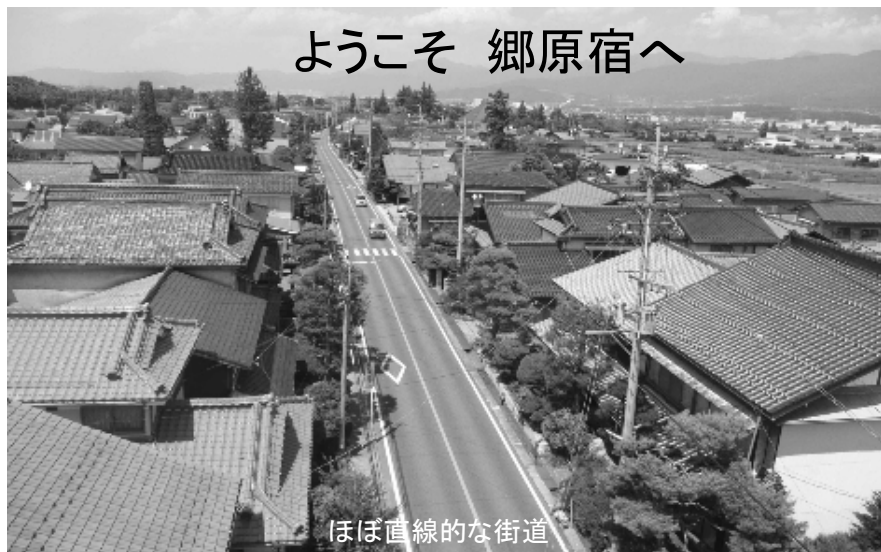
ほぼ直線的な街道