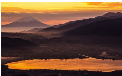
標高1,665mからの夜明け