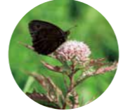
ヒヨドリバナ(8月~9月)