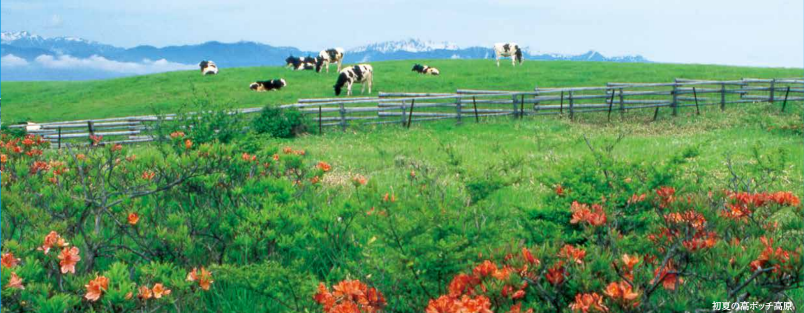
初夏の高ボッチ高原