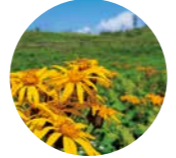
マルバダケブキ(7月~8月)