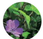
ハクサンフウロ(7月)